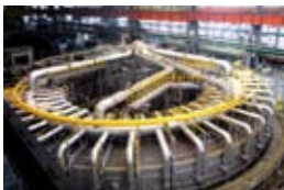
Кольцевая печь на Северском трубном заводе