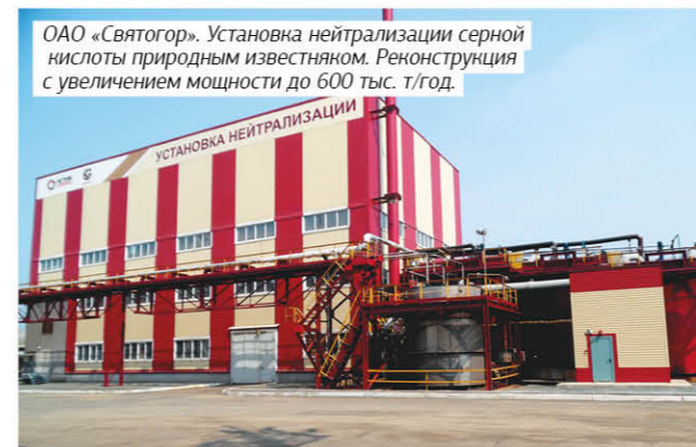
ОАО «Святогор». Установка нейтрализации серной кислоты природным известняком. Реконструкция с увеличением мощности до 600 тыс. т/год.

водителя горного оборудования, в том числе чуть ранее для Гайского ГОКа.