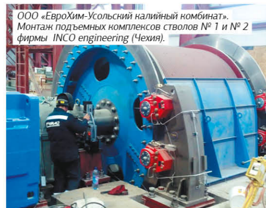
ООО «ЕвроХим-Усольский калийный комбинат». Монтаж подъемных комплексов стволов № 1 и № 2 фирмы INCO engineering (Чехия).

В 2016 г. завершено строительство шахтных подъемных комплексов для ООО «ЕвроХим-УКК»