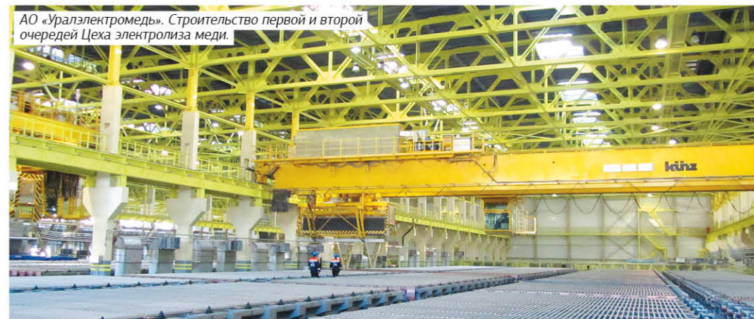
АО «Уралэлектромедь». Строительство первой и второй очереди Цеха электролиза меди.

Екатеринбург, ул. Вайнера, 34 Б Тел: +7(343)376-40-82, факс: +7(343) 376-40-92 e-mail: oao@umm2.ru Сайт: www.umm2.ru