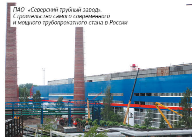
ПАО «Северский трубный завод». Строительство самого современного и мощного трубопрокатного стана в России

(г. Березники, Пермский край). В рамках реализации проекта УММ 2 осуществил монтаж четырех подъемных машин фирмы INCO. Всего компания смонтировала уже 8 машин этого мирового произ-