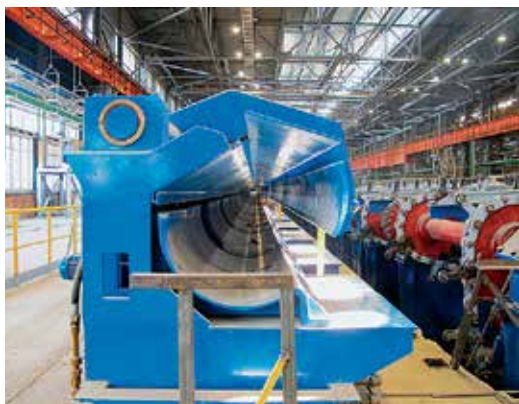
В процессе монтажа оборудования