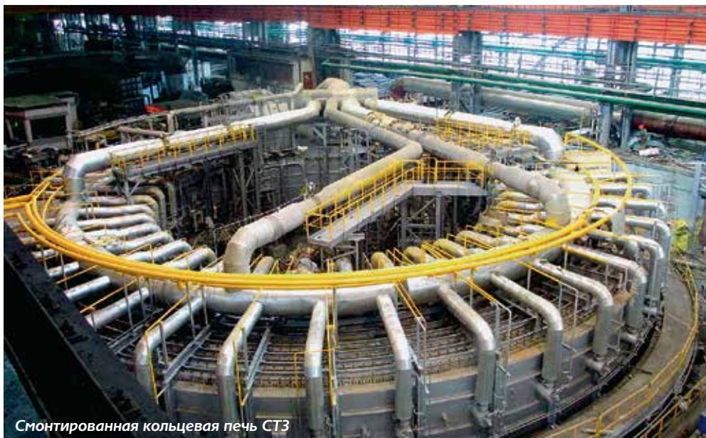
Смонтированная кольцевая печь СТЗ

Кроме того, при монтаже непрерывного стана FQM строителями «УММ 2» была разработана и применена уникальная технология по монтажу гидравлических капсул, что, в свою очередь, повлияло на сроки и результат выполненных работ. ■